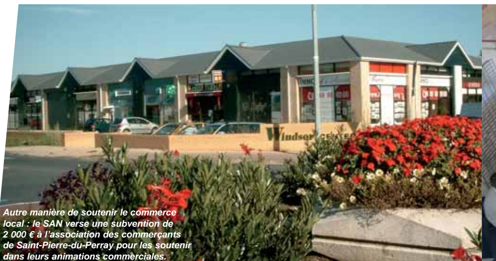
Autre manière de soutenir le commerce local : le SAN verse une subvention de 2 000 € à l’association des commerçants de Saint-Pierre-du-Perray pour les soutenir dans leurs animations commerciales.